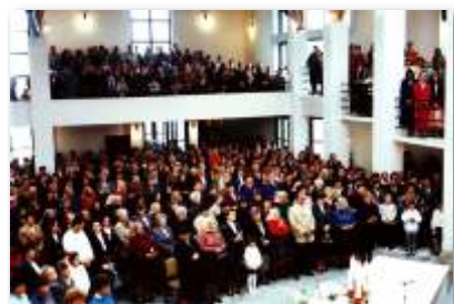
Fotografie z požehnania kostola v roku 1994 Mons. Alojzom Tkáčom.