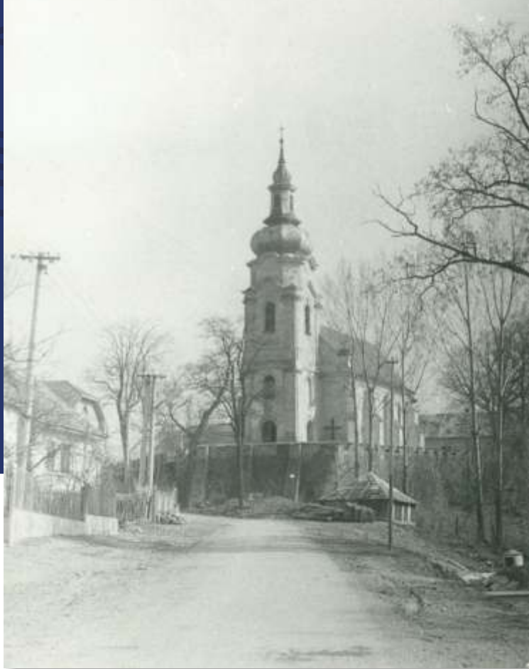
Pohľad na kostol z dnešnej ulice Matúša Čáka Trenčianskeho. Stav pre rekonštrukciu v 70. rokoch.