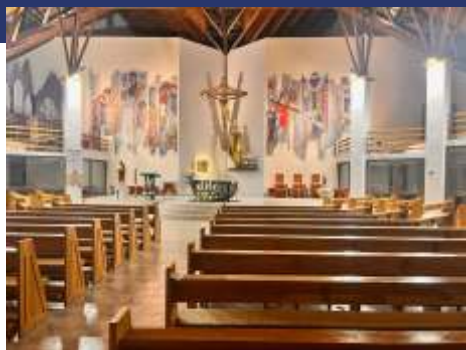
Mozaika v presbytériu kostola zobrazujúca sedem bolestí Panny Márie.