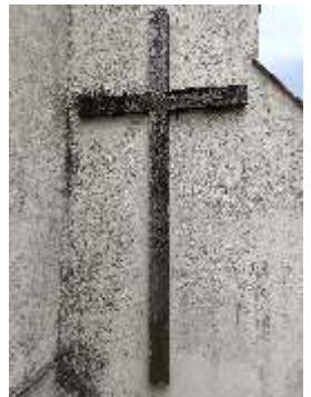
Križ na múre kostola Povýšenia svätého Kríža osadený pri príležitosti 1100. výročia príchodu sv. Cyrila a Metoda (1963).