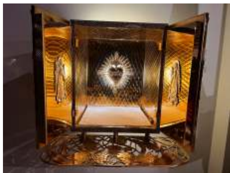
Bohostánok osadený v roku 2024.