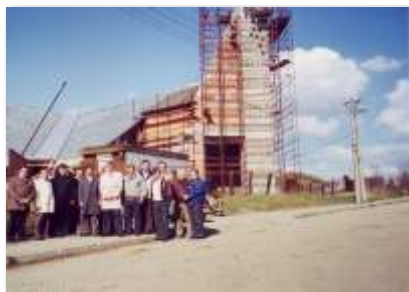
Fotografie z výstavby chrámu.