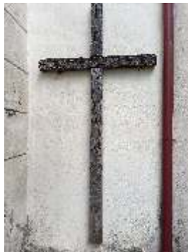
Misijný križ z roku 1938 na múre kostola Povýšenia sv. Kríža.