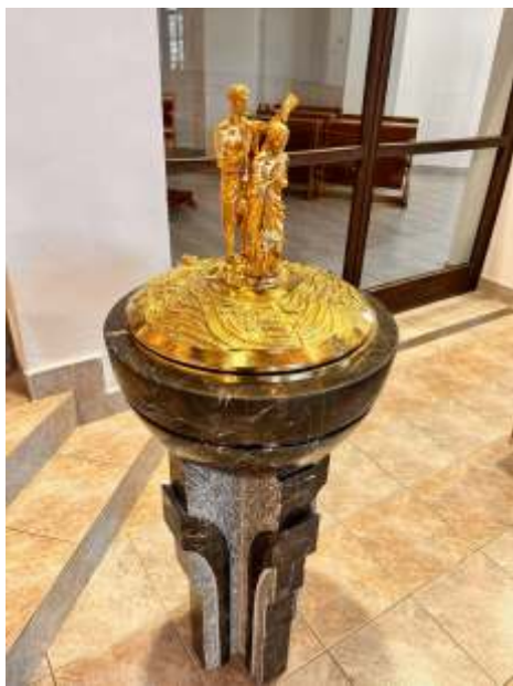
Nová krstiteľnica inštalovaná v roku 2025.