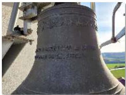
Zvon vo veži filiálneho chrámu vo Vajkovciach.

Vo veži filiálneho kostola Božieho milosrdenstva vo Vajkovciach sa nachádza zvon z roku 1922 s nápisom „ROKU PÁNA 1922 OBETOVALI K CHVÁLI BOŽEJ BUDZIMIRSKÉ KATH. VERIACI“.