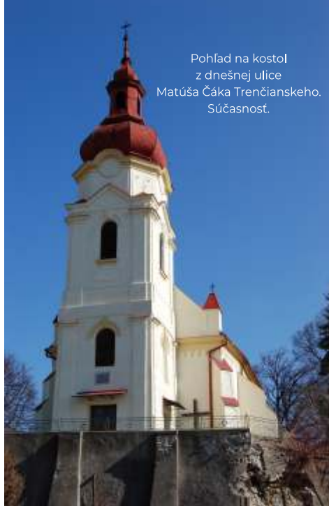
Pohľad na kostol z dnešnej ulice Matúša Čáka Trenčianskeho. Súčasnosť.

Kostol je od roku 1963 zapísaný do zoznamu národných kultúrnych pamiatok. Súčasťou inventáru kostola boli hnutelné kultúrne pamiatky: rokoková monštrancia z roku 1763, rokokový kalich z roku 1767, relikviár z druhej polovice 18. storočia obsahujúci relikvie svätého Kríža, pacifikál z roku 1770 a cibórium z roku 1774.