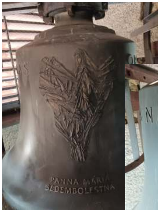
Zvon Panna Mária Sedembolestná.

Najväčší z rozhanovských zvonov nesie meno Panna Mária Sedembolestná . Bol odliaty v roku 2001 vo zvonolejárskej dielni rodiny Dytrychovej z Brodku u Přerova (Česká republika).