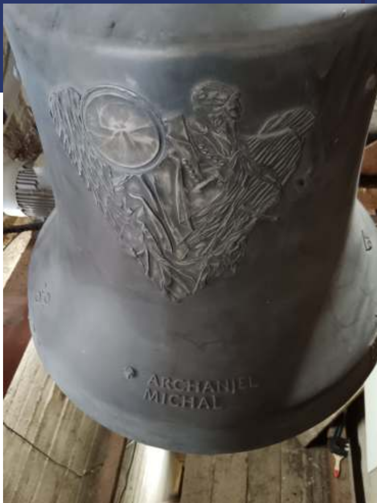
Zvon archanjel Michal.