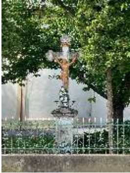
Križ pri Kostole Povýšenia svätého Kríža postavený v roku 1904.