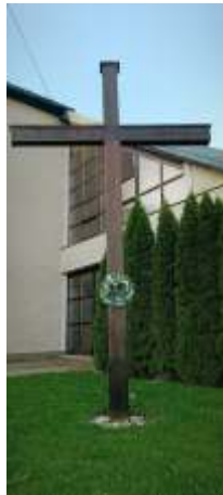
Misijný križ pri kostole Sedembolestnej Panny Márie, postavený v roku 2000 a pripomínajúci misie v danom roku a rokoch 2010 a 2025