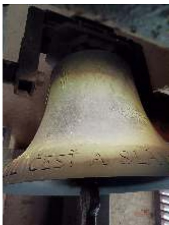
Zvon svätý Jozef.

Vo veži filiálneho kostola Božieho milosrdenstva vo Vajkovciach sa nachádza zvon z roku 1922 s nápisom „ROKU PÁNA 1922 OBETOVALI K CHVÁLI BOŽEJ BUDZIMIRSKÉ KATH. VERIACI“.