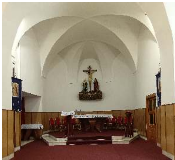
Interiér kostola v súčasnosti.

Kostol je od roku 1963 zapísaný do zoznamu národných kultúrnych pamiatok. Súčasťou inventáru kostola boli hnutelné kultúrne pamiatky: rokoková monštrancia z roku 1763, rokokový kalich z roku 1767, relikviár z druhej polovice 18. storočia obsahujúci relikvie svätého Kríža, pacifikál z roku 1770 a cibórium z roku 1774.