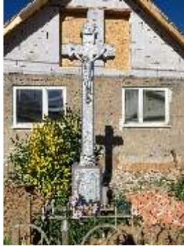
Križ pri vstupe do obce zo smeru od Košíckych Oľšian postavený v roku 1898.