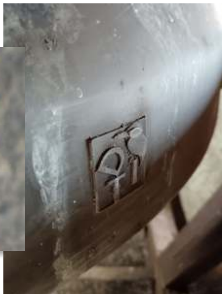
Detail znaku zvonolejárskej dielne.