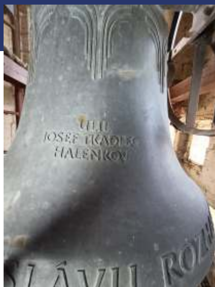
Zvon svätý Peter.